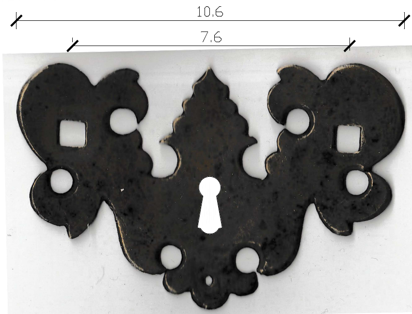
Szyld od uchwytu z dziurką na klucz do szuflad z jednym uchwytem szyld od uchwytu do szuflad z dwoma uchwytami - analogiczny ale bez dziurki do klucza mosiężny