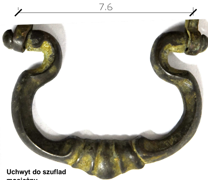
Uchwyt do szuflad mosiężny